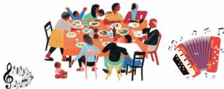
Table Ouverte Paroissiale

La Table Ouverte Paroissiale est un repas convivial ouvert à tous et à ceux que vous inviterez